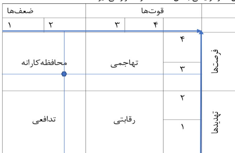
شکل ۱. ماتریس چهارخانه‌ای عوامل داخلی و خارجی

بر اساس ضرایب به دست آمده می‌توان نمودار سواتی را ترسیم کرد (شکل ۱). این نمودار، به تجزیه و تحلیل ماتریس عوامل داخلی و خارجی می‌پردازد. از آنجاکه جمع میانگین وزنی عوامل داخلی، ۲,۴۴ و عوامل خارجی ۲,۶۰ است، محل تقاطع این دو در ربع اول، نمودار یعنی بخش محافظه کارانه قرار می‌گیرد.