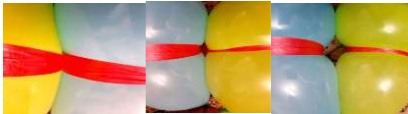
شکل (۱)- باز و بسته‌شدن روزنه‌های هوایی در گیاه با استفاده از بادکنک